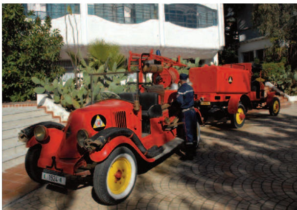
■ Musée de la Protection civile algérienne

portant de créer une dynamique commune, une dynamique forte entre tous les acteurs de la protection civile de Méditerranée ». En fait, cette plate-forme d'échange ne se limite pas aux aspects liés à la formation et à la théorie en matière opérationnelle. Le PPRD South a pour objectif principal de renforcer les fondements d'une relation durable entre l'ensemble des acteurs de la Protection civile de l'espace Euro-méditerranéen. « Nous avons la même typologie de risques – continue Khellaf - ce sont essentiellement des séismes, des inondations, des feux de forêt et des glissements de terrains. Les catastrophes n'ont pas de frontières. Par le passé, nous ne nous connaissons pas. Les échanges dans le domaine de la Protection civile se limitaient à des relations bilatérales. Aujourd'hui, nous nous connaissons et nous parlons le même langage ».