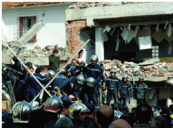
■ Les hommes de la Protection Civile Algérienne en intervention lors d'une catastrophe récente